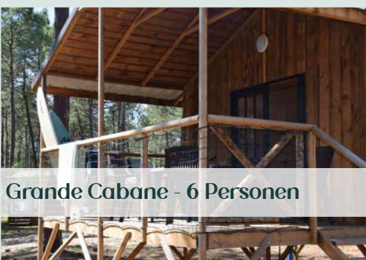
Grande Cabane - 6 Personen