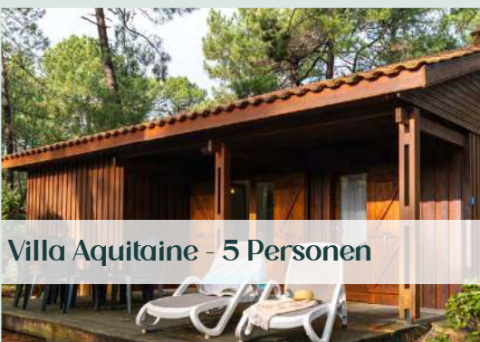
Villa Aquitaine - 5 Personen