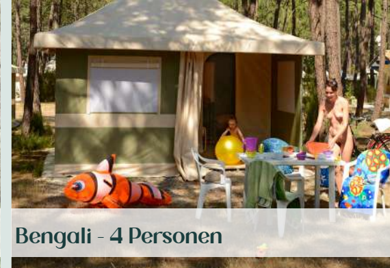
Bengali - 4 Personen