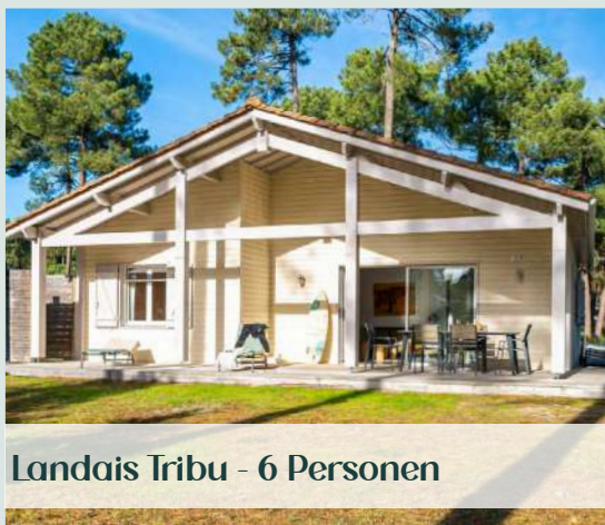
Landais Tribu - 6 Personen