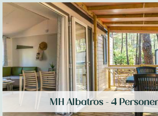
MH Albatros - 4 Personen