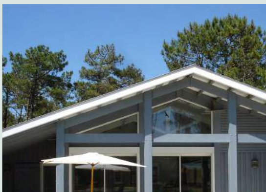
Villa Girondin - 6 Personen