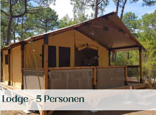
Lodge - 5 Personen

Die Unterkünfte des FKK-Zentrums Euronat sind vielfältig und für alle Familien und Budgets geeignet; vom 25-m 2 -Studio bis zum Einzelbungalow mit über 100 m 2 ; so können Sie die natürliche Schönheit um Sie herum völlig genießen.