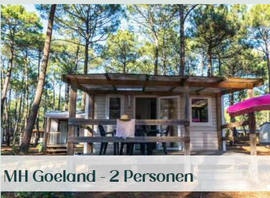
MH Goeland - 2 Personen