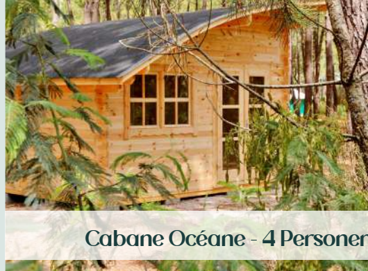
Cabane Océane - 4 Personen