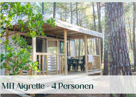
MH Aigrette - 4 Personen