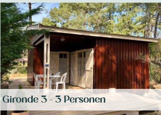
Gironde 3 - 3 Personen