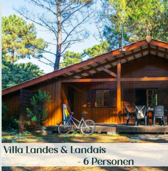
Villa Landes & Landais - 6 Personen