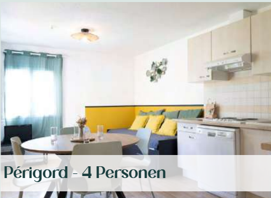
Périgord - 4 Personen