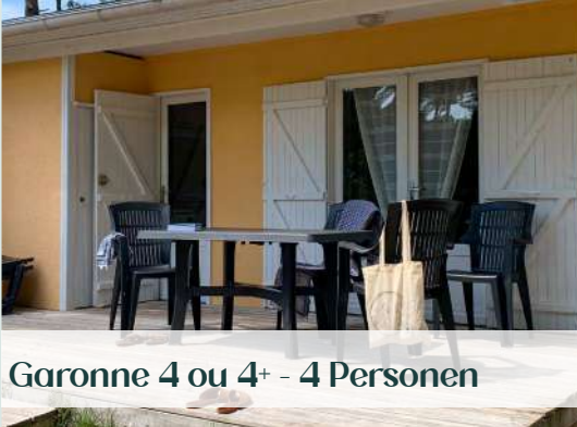
Garonne 4 ou 4+ - 4 Personen