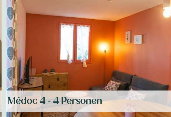
Médoc 4 - 4 Personen