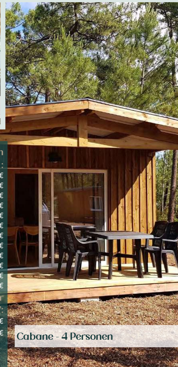
Cabane - 4 Personen