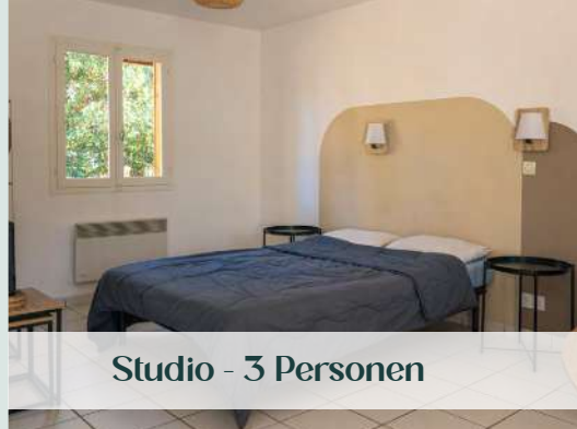
Studio - 3 Personen